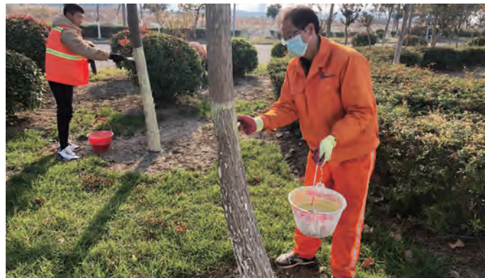
连日来,气温逐渐下降,绿植养护进入关键时期,台北(华茂)公司积极开展冬季树木涂白工作,为树木披上了一层温暖的“防护衣”,确保辖区苗木安全越冬。(房金鹤)

精心组织发运。四季度以来,运力较为紧张,销售部门多方联系运输车辆,采取车运、船运等多种运输方式,后勤人员随时对装车流程进行协助,确保各类盐产品可以第一时间发出,保证盐产品及时发运,满足客户需求。(李竹彦)