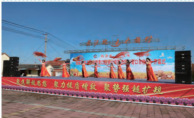
11月26日上午,青口投资公司第五届“青口丰收节”盛大开幕。本届丰收节历时一周,精心设计“五谷同心鼓、农时农事大家猜、秋收冬藏储备赛、超级排球”等10个趣味性活动,让广大职工在工作之余放松身心,尽情展示青春激昂、拼搏进取的精神风貌,以此进一步凝聚起加快推进公司高质量发展的强大合力。(段绪雯)

宣传引领阵地实现新成效。大力弘扬“劳动精神、劳模精神、工匠精神”,开展“讲述身边人的故事”主题演讲、“致敬最美劳动者”主题活动,发挥先进典型示范引领作用。深入推进产改工作,将“三组联建”与“三岗创建”有机融合,出台《积分制管理星级化考评员工管理实施细则》,对员工工作业绩、学习履职、素质提升、作用发挥等情况进行综合考评,结果“晒单亮相”,形成创先争优良好工作氛围。(王道武)