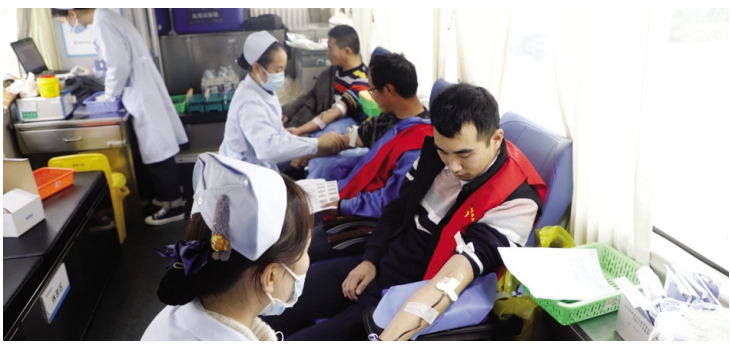
12月16日，灌西公司组织广大干部职工积极参加无偿献血，成功献血量13500毫升。近年来，灌西公司一直行走在公益道路上，越来越多的灌西人加入到爱心献血的行列，成为无偿献血的宣传者和实践者。（张明建）