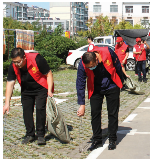
为进一步推进板桥区域联动共建活动向基层党组织拓展,9月18日,板桥片区党建联动共建单位开展“文明创建、党员率先”创文志愿服务活动,22名党员志愿者深入台南社区捡拾垃圾,美化社区环境,助力我市全国文明城市创建工作。(顾孟)