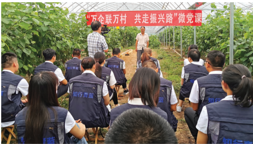
6月17日下午,青口投资公司组织10名“蓝马甲”青年管理人员前往赣榆区海头镇采风学习,本次活动既是“蓝马甲”特训营实践课程,也是与海头镇党委“万企联万村,共走振兴路”的一次共建活动。图为“蓝马甲”学员在大官庄村桑葚采摘园听取桑葚产业发展历程。(顾益)