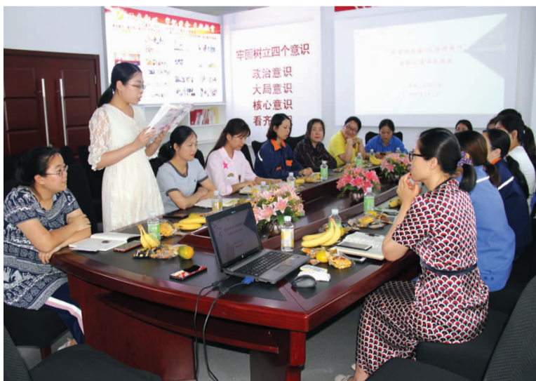
近日,利海化工公司女工委开展“书香润利海·文明伴我行”女职工主题读书活动,8名女职工代表分享触及心灵的文章,交流自己工作、生活、读书等方面的感悟,营造出“朗诵劳动之歌,积淀文化底蕴”的书香利海氛围。(顾孟)

近日,供电工程分公司离退休党支部通过多种形式,认真组织党员学习《习近平谈治国理政》第三卷。