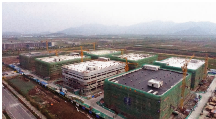
近期,房地产公司自贸区“中华药港”项目抓住有利天时,全力推进项目建设,截止目前,一期工程7栋厂房全部进入装饰装修阶段,2个雨水调蓄池已完成桩基施工,危险废物废库已完成主体施工,污水处理站正在进行桩基施工。(房宣 徐霞)